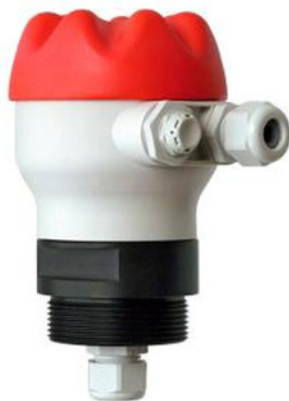
Anschlusskopf BJSC mit integrierter Belüftung (optional)