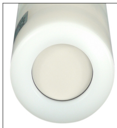
Ansicht von unten Keramikkesszelle 99,9%